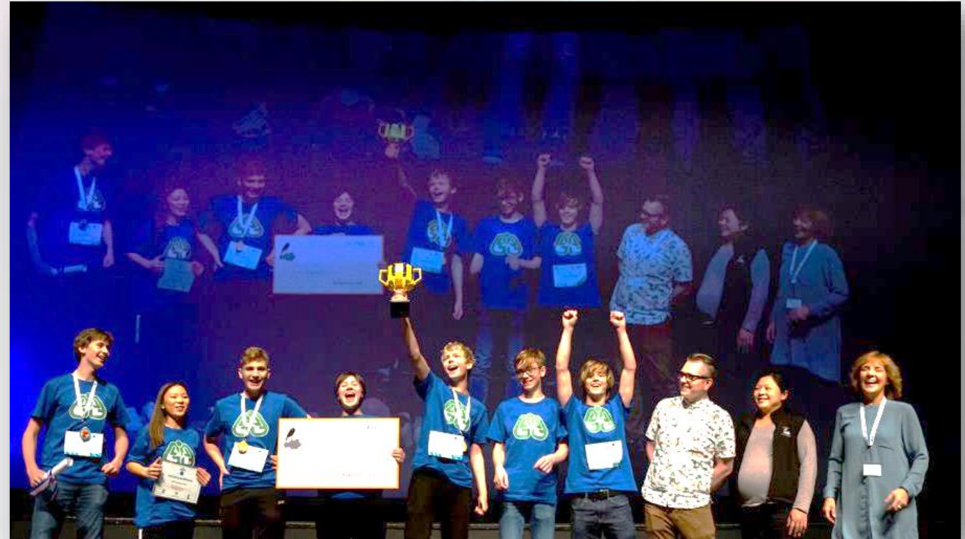
Sigurlið FLL 2019: Garðálfar frá Garðaskóla